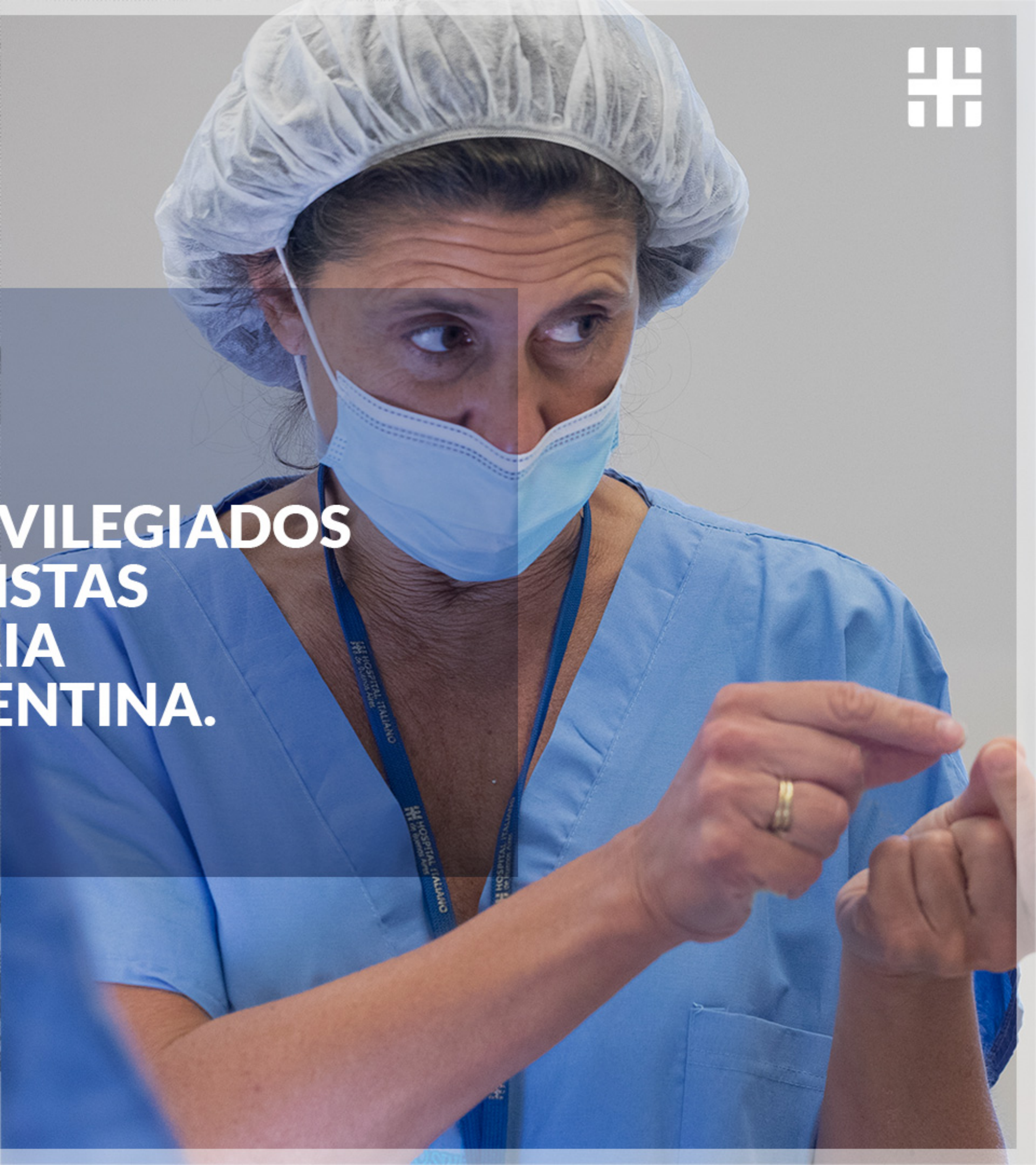
CUERPO MÉDICO DEL HOSPITAL

DESDE 1853, TESTIGOS PRIVILEGIADOS Y PROTAGONISTAS DE LA HISTORIA MÉDICA ARGENTINA.